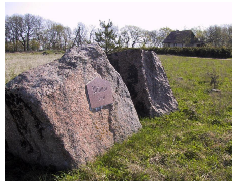
1991.a. tähistati arvatav küla-ase mälestuskiviga

Taani Hindamisraamatust ei selgu, kus täpselt see Uianra, Vianra või Viama küla asetses, kuid aratakse, et kuskil poolsaare keskosa klindikõrgendikul. Küla on seostatud 1689.a. kaardil näha oleva Vehema kopluga, mis asub üsna lähedal vanale matmispaigale, "Rootsi kuninga hauana" tuntud kivikirstkalmele. Matusepaigast umbes 150m. eemal, niiske madala lohu serval avastati 1971.a. tõepoolest asulakoha kultuurikiht - põlenud kivide, šlakitükkide, luude ja väheste potikildudega. Senised napid leiud pärinevad, nii nagu Rootsi kuninga haua omadki, umbes Kristuse sündimise ajast. Umbes kilomeeter maad eemal, endise Niine talu mail on leitud teinegi muinasaegne matmispaik, nimelt kolm-nelisada aastat hilisemast ajast pärit tarandkalmed. Mõlemad hauakohad on mullatöödega tugevalt kahjustatud.